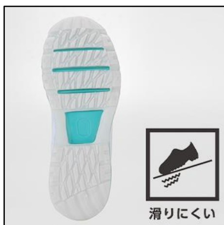
【滑りにくいソール】