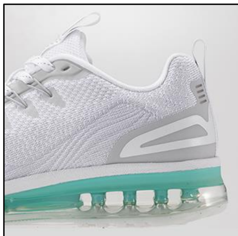
【全方向エア入りクッション】