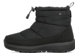
ブラック/ブラック