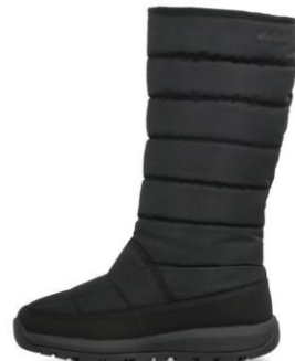
ブラック/ブラック (250005)