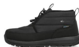
ブラック/ブラック