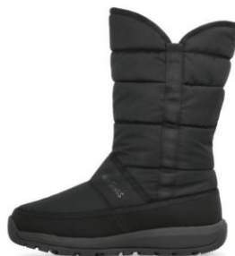
ブラック/ブラック (250004)

価格 : ￥9,500 (税込 ￥10,450) サイズ : 23.0cm～25.0cm ※ハーフサイズなし カラー : ブラック/ブラック