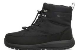
ブラック/ブラック