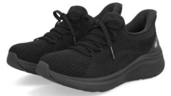
ブラック/ブラック